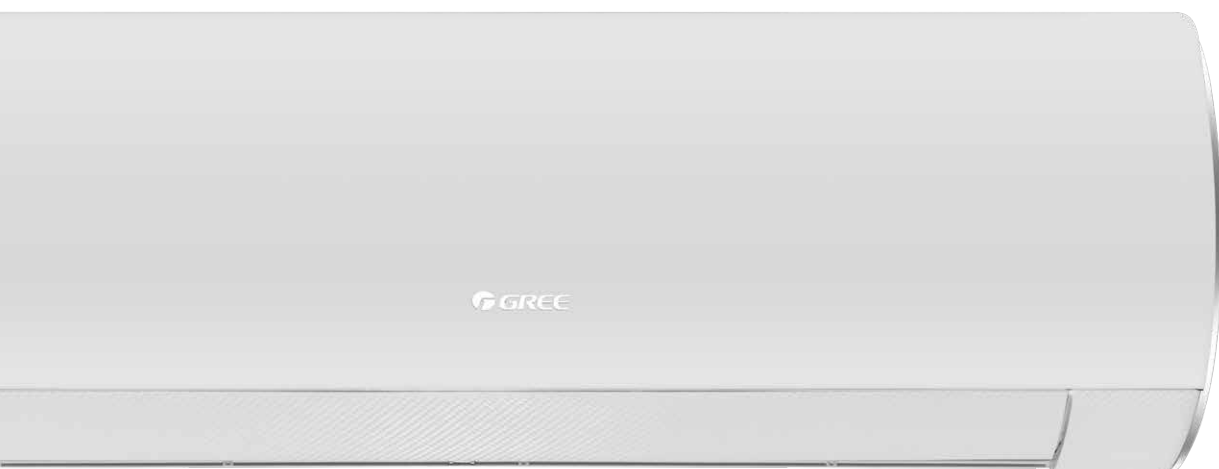
panel błysk White