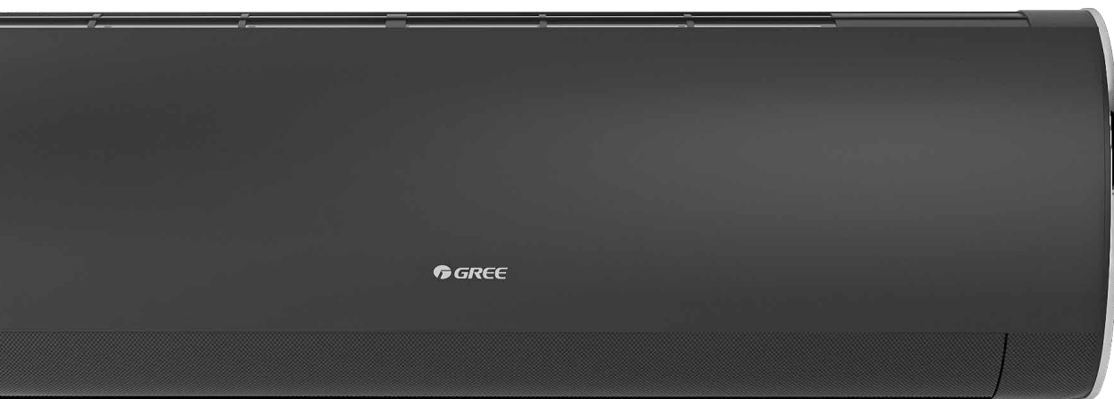
panel matowy Dark