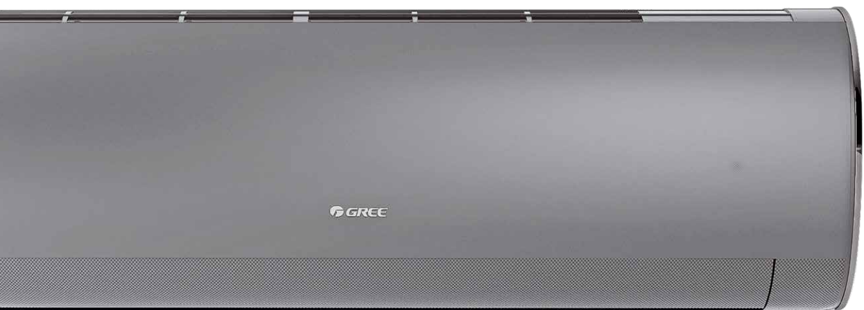
panel matowy Silver